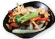
53. Kon bao chicken Kip met licht pikante saus Chicken with light spicy sauce