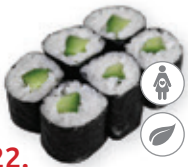
22. Kappa maki Komkommer Cucumber