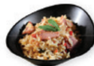
64. Fried rice chicken Gebakken rijst met kip Fried rice with chicken