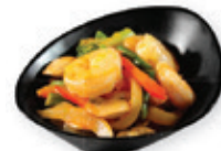
57. Thai prawn Garnaal met thaise curry saus Prawn with thai curry sauce