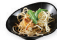
66. Bami Gebakken bami met ei Fried noodles with egg