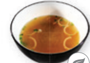
46. Miso soup Sojabonen soep Soybean paste soup