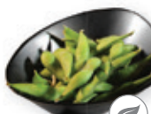
44. Edamame Sojabonen Soybeans