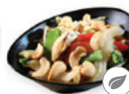
60. Tjap tjoy Verse groentemix Fresh vegetable mix