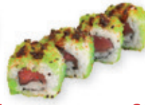
31. Lucky maguro Tonijn met wasabi masago Tuna with wasabi masago