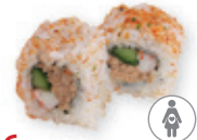
36. Ura maki Pikante tonijn salade Spicy tuna salad