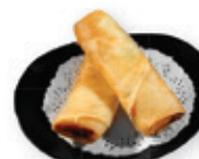
40. Spring roll Kip loempia Chicken spring roll