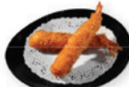
38. Kushi Gefrituurde garnaal Deepfried prawn