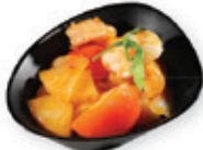
58. Tropical prawn Garnaal met zoetzure saus Prawn with sweet & sour sauce