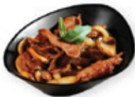
56. Tokyo beef Rund met japanse sojasaus Beef with japanese soy sauce