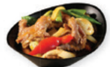
55. Thai beef Rund met thaise curry saus Beef with thai curry sauce