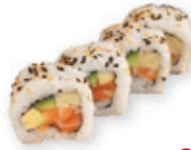
30. Salcum maki Zalm met komkommer Salmon with cucumber