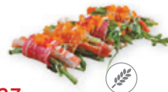
37. Sashimi roll Salade mix gerold in sashimi Salad mix rolled in sashimi