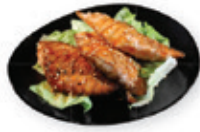
51. Salmon teriyaki Zalm met teriyakisaus Salmon with teriyaki sauce