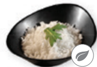
62. White rice Witte rijst White rice