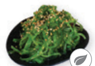
68. Chuka wakame Zeewier salade Seaweed salad