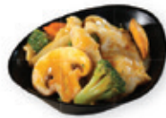
52. Thai chicken Kip met thaise curry saus Chicken with thai curry sauce