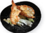
70. Grilled prawn Gegrilde garnalen Grilled prawns