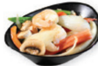
59. Garlic seafood Zeevruchten met knoflooksaus Seafood with garlic sauce