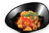
65. Fried rice prawn Gebakken rijst met garnalen Fried rice with prawn