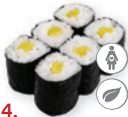
24. Oshinko maki Ingelegde rammenas Pickled radish