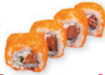
29. Salmon cheese roll Zalm met kaas Salmon with cheese