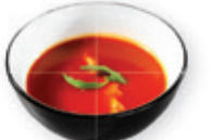
48. Tomato soup Chinese tomatensoep Chinese tomato soup