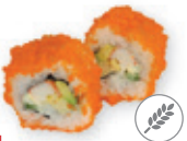
34. California maki Krab, avocado, komkommer Crab, avocado, cucumber