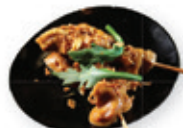
41. Sate ayam Kipsaté met pindasaus Chicken satay with peanut sauce