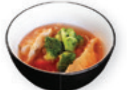
47. Wonton soup Kippasteitjes soep Chicken dumpling soup