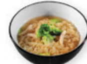
45. Noodle soup Bami soep met kip Noodles soup with chicken