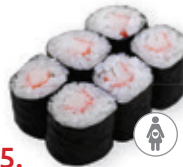
25. Kani maki Krabstick Crab stick