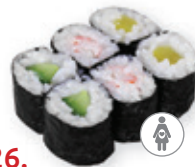
26. Doremi maki Maki mix Maki mix