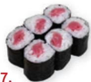
27. Tekka maki Tonijn Tuna