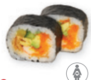
33. Futo maki Grote rol Big roll