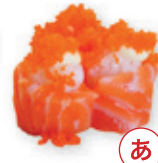
32. Sake tobiko Zalm met viskuit Salmon with fish roe