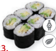
23. Avocado maki Avocado Avocado