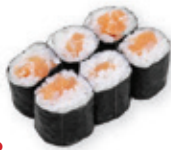
28. Sake maki Zalm Salmon