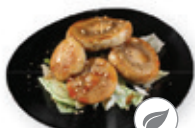
43. Yaki mushroom Gegrilde champignons Grilled mushrooms