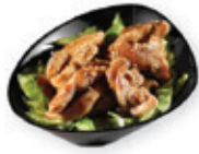
50. Chicken teriyaki Kip met teriyakisaus Chicken with teriyaki sauce