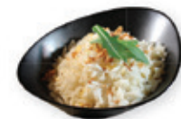
63. Nasi Gebakken rijst met ei Fried rice with egg