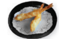
69. Tempura prawn Gefrituurde garnaal Deepfried prawn