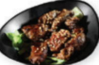
49. Beef teriyaki Rund met teriyakisaus Beef with teriyaki sauce