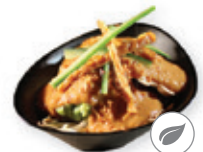
61. Gado gado Groentemix met pindasaus Vegetable mix with peanut sauce