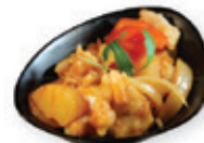
54. King doo chicken Kip met zoetzure saus Chicken with sweet sour sauce