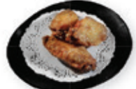
42. Tori furai Kipvleugels Chicken wings