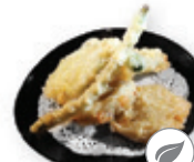
39. Tempura vegetables Gefrituurde groenten Deepfried vegetables