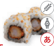
35. Kushi maki Gefrituurde garnaal Fried prawn