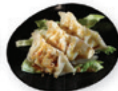
71. Gyoza Kippasteitjes Chicken dumplings